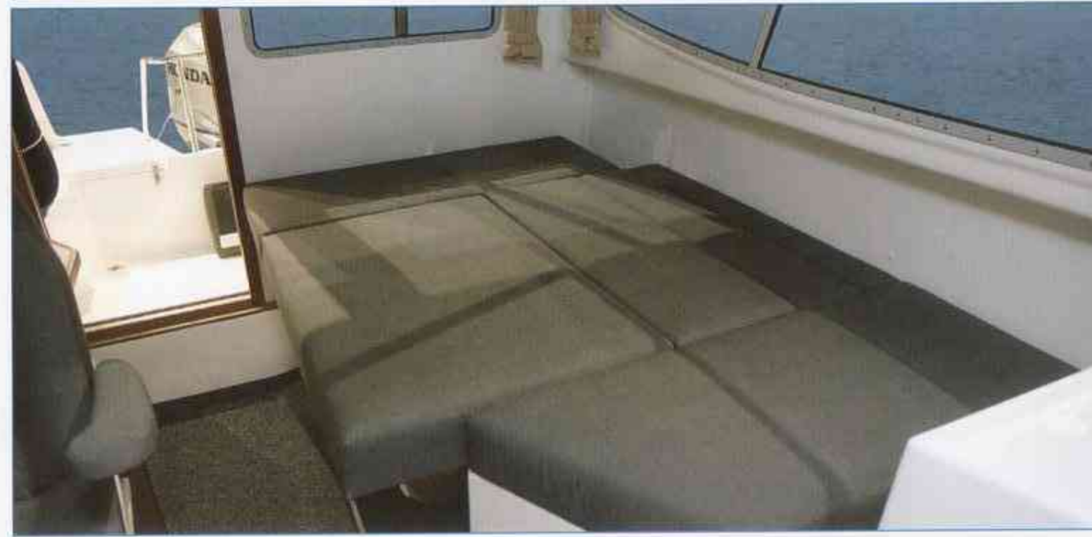
Esitteen venekuvissa myös lisävarusteita. Båtarna i bilderna innehåller tilläggsutrustning. The pictured boats are with optional accessories. Das Bild zeigt das Boot mit extra Zubehör.