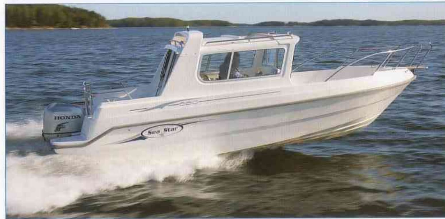
Esitteen venekuvissa myös lisävarusteita. Båtarna i bilderna innehåller tilläggsutrustning. The pictured boats are with optional accessories. Das Bild zeigt das Boot mit extra Zubehör.