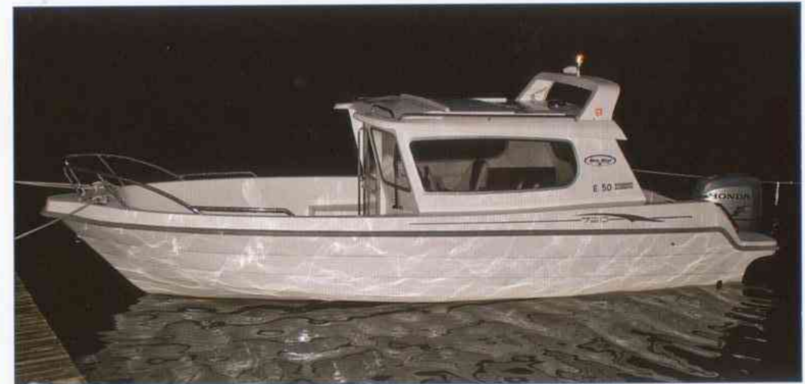
Esitteen venekuvissa myös lisävarusteita. Båtarna i bilderna innehåller tilläggsutrustning. The pictured boats are with optional accessories. Das Bild zeigt das Boot mit extra Zubehör.